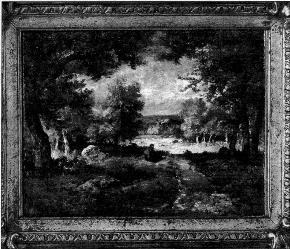
L'École de Barbizon : les plus grands peintres ont célébré la forêt

produire la vingtaine de pièces de cette exposition de dessins. En clôture, un concours récompensera les auteurs des meilleurs œuvres plébiscitées par le public.